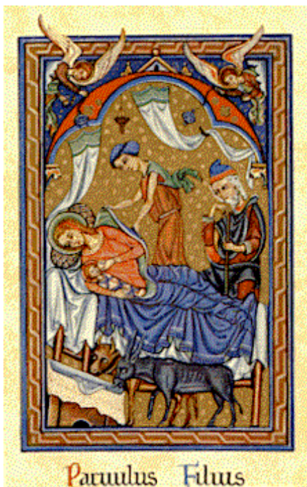
- Parvulus Filius - le Fils Tout-Petit - Bénédictines de Caen d'après le Missel D'Exeter (1228)