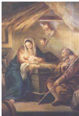
Jésus né dans une pauvre étable. (Luc 2,1-20)

Aujourd'hui, un Sauveur nous est né, dans la ville de David. Il est le Messie, le Seigneur. Les anges chantent : « Gloire à Dieu, dans les cieux et, paix aux hommes sur la terre. »