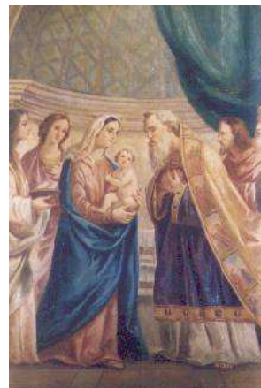
Jésus présenté par vous au Temple. (Luc 2,22-40)

En signe de soumission à la Loi et de fidélité religieuse, Marie consacre Jésus au Seigneur.